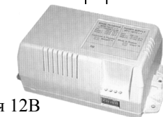
блок питания 12В