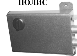
электромеханический замок ПОЛИС