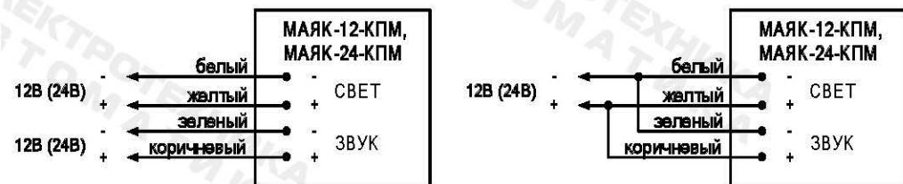
Рис.1. Схема подключения.

3.3. По окончании монтажа необходимо провести внешний осмотр и убедиться в отсутствии повреждений корпуса и проводов.