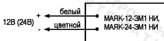
Рис.1. Схема подключения.