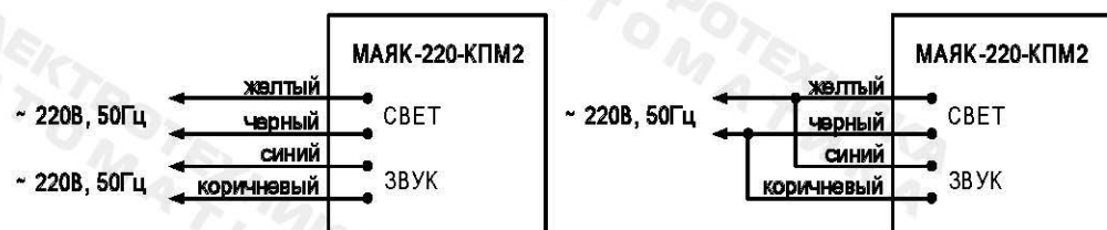
Рис.1. Схема подключения.

3.2. Подключение изделия должно производиться в соответствии со схемой (рис.1.) при отключенном напряжении питания.