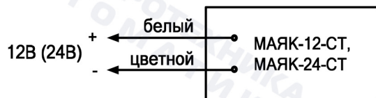
Рис.1. Схема подключения.