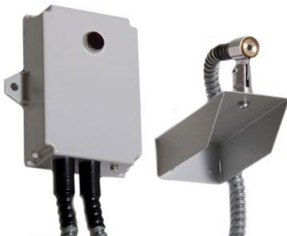
Рис. 1. Извещатель