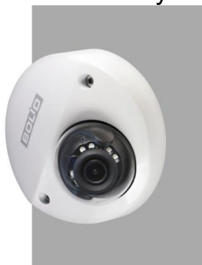
Рисунок 4.2 – Монтаж видеокамеры