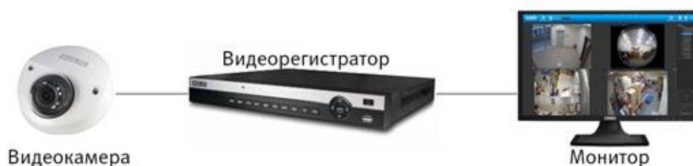
Рисунок 5.2 – Схема подключения видеокамеры